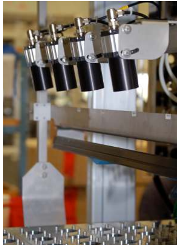
„Alles im Blick: Insgesamt sechs Kameras überwachen den Abfüllprozess“